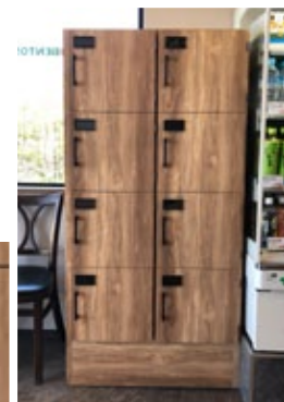
引き渡しロッカー